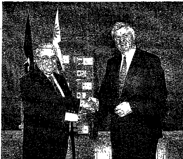
Una donación que provoca alegrías.